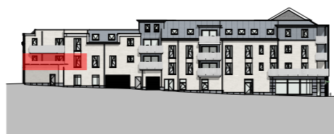
FACADE - Ruelle des Vieux Fossés