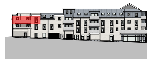
FACADE - Ruelle des Vieux Fossés